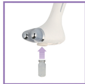
Ампула AQUA PEPTIDES рассчитана на 1 применение

Внимание! Извлеките остатки препарата из отверстия, используя мягкую слегка влажную ткань. Несвоевременная очистка может привести к засорению отверстия.